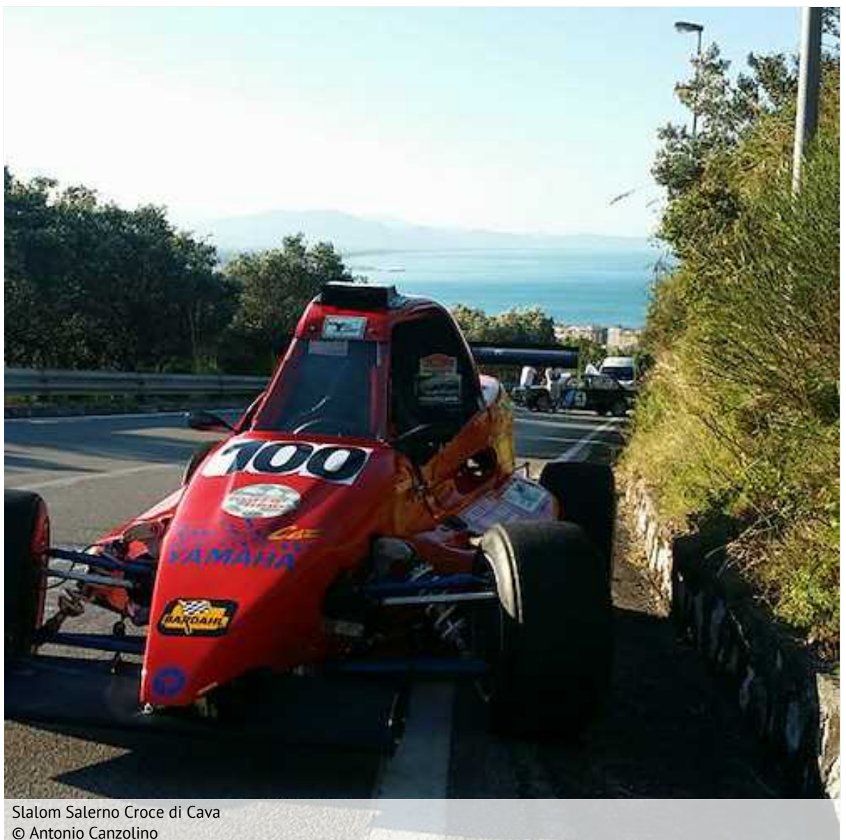
Slalom Salerno Croce di Cava